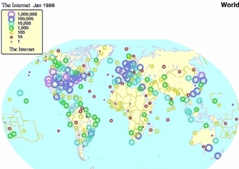
Répartition des accès à l'Internet dans le monde. 1999